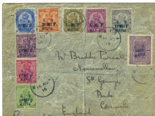
5 Sur ce pli parti de Mafia en 1916 à destination de l'Angleterre, huit valeurs de l'IEF cohabitent avec un timbre fiscal de l'Ost-Africa, le Statistik des Waarenwerkhers à 1 roupie. Tous les timbres comportent la surcharge « G.R. POST MAFIA ».