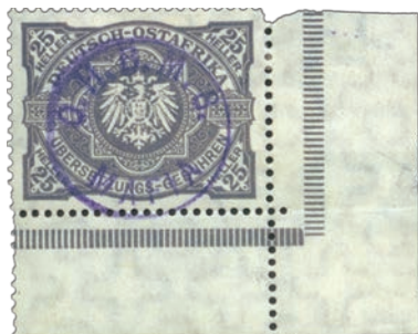
4 Bel exemplaire du 25 heller Übersetzungs Gebühren en bord de feuille, surchargé « O.H.B.M.S. MAFIA » à l'encre violette.