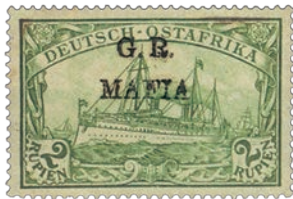
1 Voici l'un des rares exemplaires (5 connus) du yacht Hohenzollern surchargé de la mention « GR MAFIA » à l'encre noire.