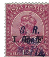
10 Surcharge en caractères italiques apposée deux fois.