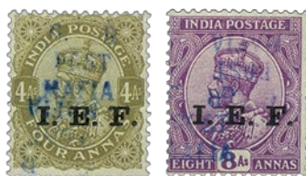
6 Exemplaires surchargés deux fois, une fois à l'endroit, une fois à l'envers.