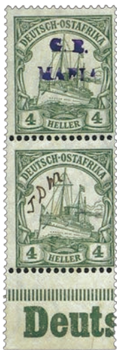
2 Une paire du 4 hellers de la série yacht où cohabitent un exemplaire surchargé et un autre « oublié », qui porte la mention manuscrite « JDM », initiales du gouverneur de l'île.