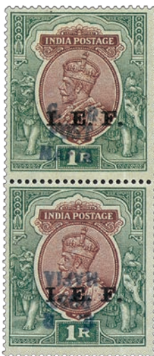
7 Superbe paire verticale du timbre de l'IEF à 1 roupie présentant l'un des deux exemplaires surchargé à l'envers.