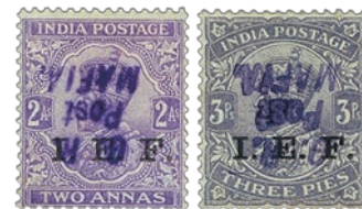
11 Surcharges italiques renversées.