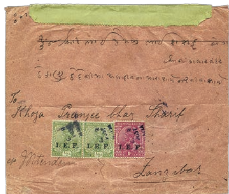
9 Pli à destination de Zanzibar affranchi avec trois timbres de l'IEF à surcharge oblique.