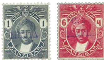
12 Timbres de Zanzibar surchargés « GR MAFIA » à des fins probablement philatéliques.