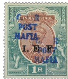
8 Double surcharge bleu-foncé.