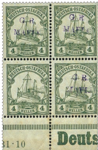
3 Sur ce bloc de quatre, un exemplaire sans surcharge côtoie trois timbres dûment surchargés.

Mafia est située une centaine de kilomètres au sud d'Unguja, une île mieux connue sous le nom de Zanzibar, au large de la Tanzanie actuelle. Avec Pemba et Unguja, c'est l'une des trois principales îles qui forment l'archipel géographique de Zanzibar. Mais administrativement et politiquement, Mafia a toujours connu un statut à part, à la fois proche de celui de Zanzibar, sans être vraiment logée à la même enseigne. Dès le VIII e siècle, Mafia constitue une étape privilégiée pour les navires perses désireux de rallier le continent africain. Les Arabes, les Perses et les Swahilies s'intéressent alors à l'île et y imposent successivement leur domination. Puis vient l'époque où Zanzibar connaît ses heures de gloire, ses temps mythiques : en 1840, le sultan d'Oman, Saïd, décide d'installer le siège de son gouvernement à Zanzibar. Plus qu'un simple dirigeant politique, c'est aussi un excellent homme d'affaire, porté sur le commerce