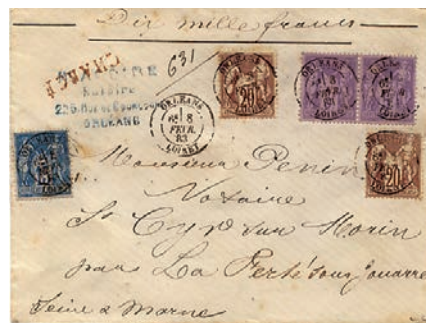
3 Le 5 francs sert fréquemment de valeur de base, accompagné d'autres Sage.