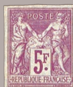
12 Non dentelé officiel.