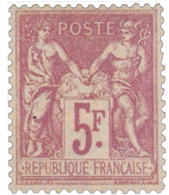
1 Le 5 f Sage complète la série le 1 er juin 1877.

L'arrivée du 5 francs 1 dans la série des Sage a lieu une bonne année après le lancement des Paix et Commerce, pour une raison purement économique : les autorités postales veulent écouler l'immense stock restant de 5 francs Lauré, le célèbre classique au grand format (n° 33). Mais la figure de l'empereur déchu n'a pas de succès, loin de là ! Les ventes sont infimes, ce qui confère aujourd'hui à ce timbre une cote assez haute, et le ministre des PTT, Léon Say, décide finalement de détruire les innombrables feuilles restantes parmi les quatre millions de timbres imprimés. Le but de l'opération est de relancer un peu les ventes en oubliant le visage de Napoléon III au profit d'un motif plébiscité par le public. Et notre Sage voit le jour au guichet le 1 er juin 1877.