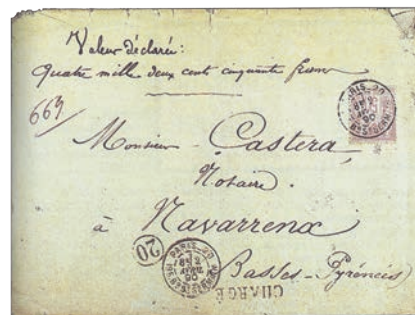
2 Souvent utilisé pour les recommandés en valeur déclarée, il est rare de tomber sur un tarif de 5 f pile.

Une forte valeur faciale implique une vente modérée et, par conséquent, un tirage parcimonieux. Voilà de quoi assurer une certaine rareté sur la scène philatélique. Pourtant, le 5 francs Sage n'est pas le classique le plus prisé de nos jours, ni le mieux coté. C'est peut-être un tort car son destin est bien singulier au milieu de la très grande famille des Sage.