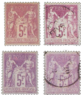
4 Le lilas de base se décline en une multitude de jolies nuances.