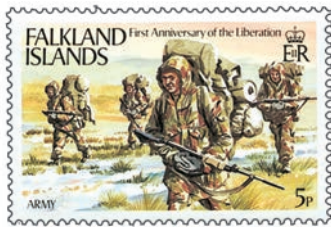
L'anniversaire de la « libération » des Falkland commémoré par les Britanniques.

L'Argentine a toujours revendiqué les Falkland et ce timbre émis le 1 er janvier 1936 est là pour le rappeler.