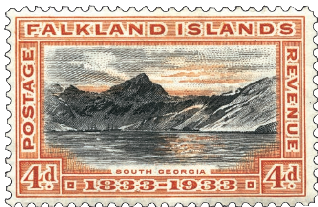
Des timbres finement réalisés.

Les îles Falkland ont d'abord été françaises avant de devenir britanniques bien que toujours revendiquées par l'Argentine. La collection des Falkland comme celle de la Géorgie du Sud ou de l'Antarctique britannique s'apparente un peu à celle de nos TAAF. Peu d'émissions, de belles vignettes qui ont des choses à raconter, la collection de timbres des terres australes dépasse les critères de choix nationaux et ne peut que passionner les philatélistes « citoyens du monde » intéressés par l'écologie.