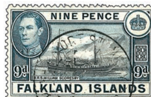
Les timbres des années 1930 ne manquent pas de charme et sont pour la plupart abordables.