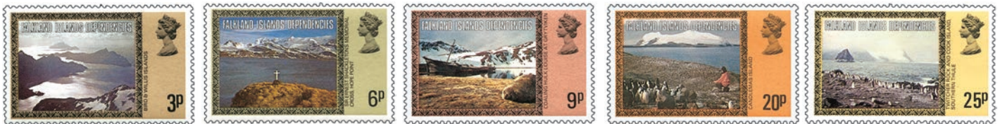
Cinq timbres de cette magnifique série émise en 1980. Vous la retrouverez répertoriée dans l'Yvert à « Dépendances - Géorgie du Sud ».

Les passionnés de la thématique oiseaux trouveront leur bonheur avec de fort belles séries.