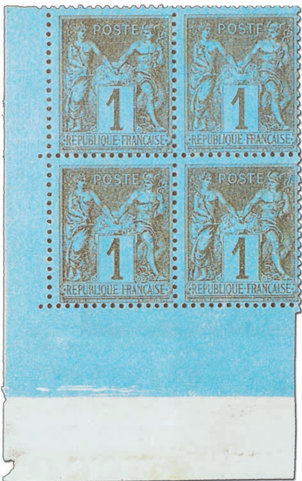
Un des trois seuls blocs de 4 connus du 1c Bleu de Prusse neuf.