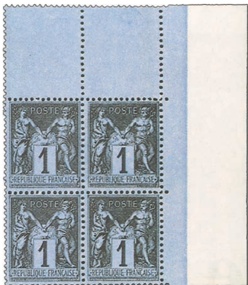
Le fond violacé n'est pas celui du Bleu de Prusse. Il provient d'un tirage de 1884 et ne cote que 20 euros.

●●● concernées et quatre timbres voient leurs couleurs modifiées : les 1, 2, 4 et 10 centimes. On en profite également pour changer la nuance du 25 centimes qui passe du bleu outremer au bleu de Prusse pour des considéra-