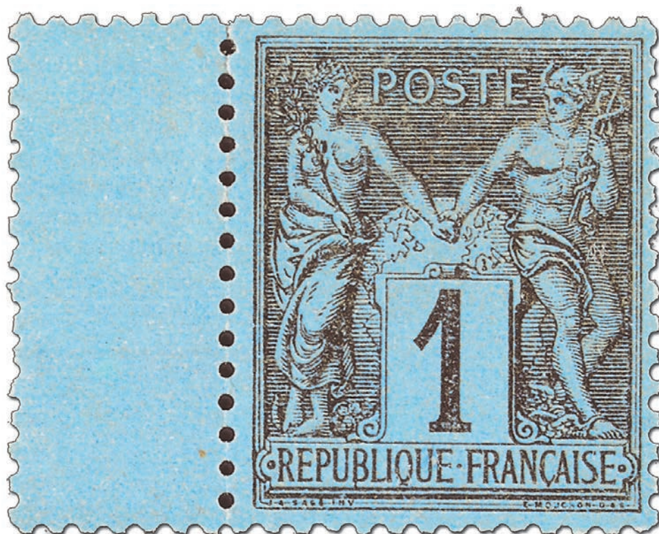
Rare, un exemplaire du Bleu de Prusse neuf et parfaitement centré.

Apolitique au possible, donnant l'impression d'être gravée alors qu'elle n'est que typographiée, la première émission de 1876 a tous les atouts pour réussir sauf... un petit problème de couleurs que l'on va très vite rectifier. Et ce ne sont pas les collectionneurs qui vont s'en plaindre.