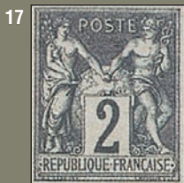
16/17. Dentelé et non dentelé. A gauche, un 2 c très frais et à droite un non dentelé de la même valeur.