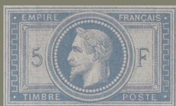
22 Cher ! 6 480 € pour obtenir ce superbe 5 f gris-bleu.