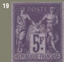
18/19. Bristol et bristol. Le timbre de gauche est un tirage de luxe sur bristol, l'autre une vignette de la série Régents de la Banque de France également imprimée sur bristol.