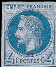
Une autre nuance de couleur.