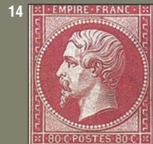
11 à 13. Une belle palette de timbres différents. Le n° 11 est un essai de couleur, le 12 un Rothschild, le 13 un colonial et le 14 une rare réimpression.