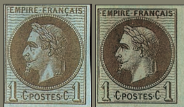
3/4 Affaire de couleur. Variété de couleur ? Non, tout simplement le 1 c de gauche est un timbre colonial, l'autre une réimpression Granet...