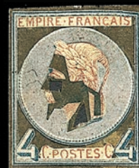
De bonnes illustrations de ce que l'on appelle une mise en train ou contre-partie.

évoquer les non dentelés émanant de feuilles spécimen ou de feuilles témoins notamment. Il n'est pas aisé de différencier certains non dentelés les uns des autres mais leur collection est passionnante et des valeurs sont abordables. Pour éviter tout problème, nous vous conseillons d'avoir