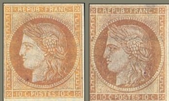
5/6 Même remarque. Ce 10 c Siège est d'un côté (3) un timbre colonial, de l'autre une réimpression Granet.