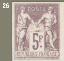
24 à 26 Nuances. Intéressant également. De gauche à droite : un essai de couleur sur papier bristol, le 5 c de la série Régents avec teinte de fond et la même série sans teinte de fond.