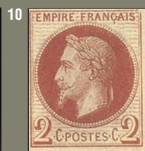
Histoire de 2 c. Les numéros 7 et 8 sont des essais, le 8 se rapprochant de la couleur du timbre émis. Le 9 est bel et bien un non dentelé officiel et le 10 un Rothschild. En l'absence de texte officiel, la tradition philatélique veut que les timbres de cette émission laurée soient venus d'un cadeau fait par Napoléon III au baron de Rothschild.