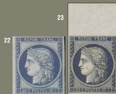
22/23. Granet et un frère non dentelé.