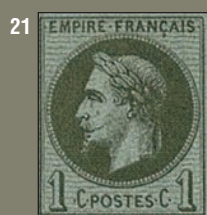
20/21. Rothschild et Granet