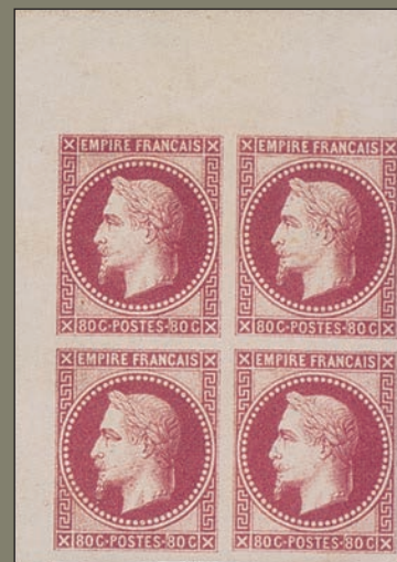
15 Rothschild. Un superbe bloc de 4 de l'émission Rothschild mis à prix dans une vente Behr à 1 675 €.