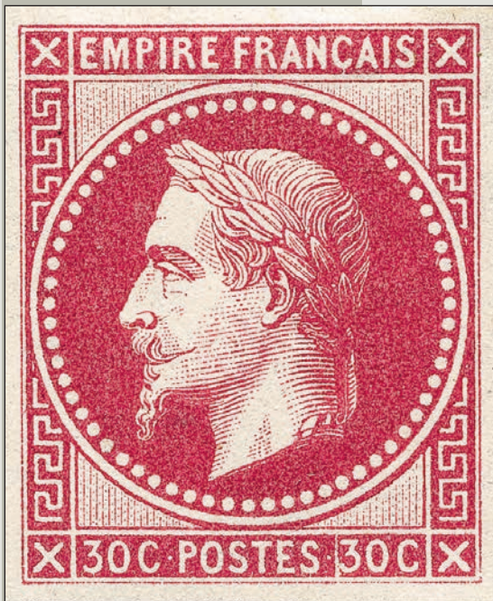
Un timbre du tirage de l'Exposition universelle de 1867.

Avec ce numéro, abordons la période des classiques de France riche et passionnante dans le domaine des non dentelés. La raison en est très simple : nos chers timbres ont été conçus ainsi à l'origine. Il faut attendre août 1862 – et après bien des réticences de l'incontournable Anatole Hulot, responsable de la fabrication – pour voir apparaître des timbres dentelés. Les 5, 10 et 20 c Empire entrent en piste puis ce sera le tour des 1, 40 et 80 c qui parviennent en septembre dans les bureaux de poste et enfin les Lauré . Alors que les timbres dentelés arrivent, on retrouve fort curieusement en cette année 1862 des non dentelés ! C'est à tout le moins surprenant et c'est de cela dont il sera question dans cet article. Pour mieux comprendre les raisons qui ont présidé à réaliser à nouveau des non dentelés, il faut se pencher sur les différentes catégories de ces timbres étonnants.