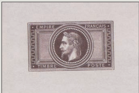
Une épreuve sans le 5 et le F, très rare.

Compte-tenu de ce qui précède, les épreuves ne posent pas de problème d'identification. Elles font l'objet de cotations.