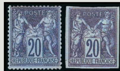
Le non émis dentelé et le non émis non dentelé. Ce dernier cote 274 €.

Il s'agit de ce beau 20 c Sage bleu sur turquoise non dentelé et non terminé. Nous aurons l'occasion de revenir sur son histoire.