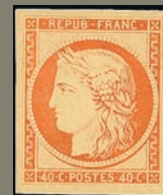
1/2 A gauche une cote de 4 000 €, à droite seulement 400 €. Le timbre de gauche est en effet une Cérés de l'émission de 1849, de l'autre une réimpression de 1862.