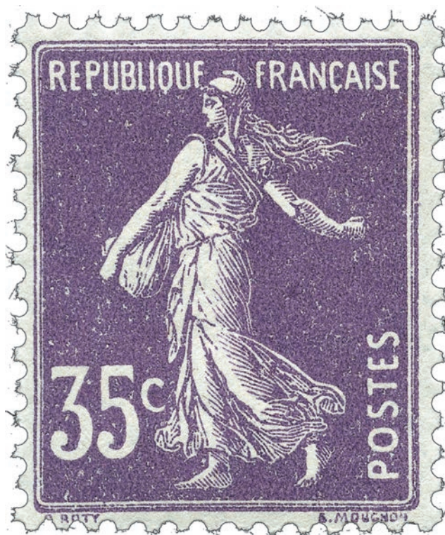
Semeuse camée type 1.

Quel collectionneur ne possède pas dans ses albums des Semeuse ? Ces timbres sont passionnants à collectionner car, entre autre chose, ils réservent parfois de bonnes surprises. L'existence de types, sous-types et variétés, est l'apanage des Semeuse et bien entendu la cote s'en ressent. Ce mois-ci redécouvrons le 35 c. Entre la « maigre » et la « camée » les spécialistes affichent vite leur préférence. Normal, la cote varie de 18 € à 1 100 €. A vous de savoir identifier les « bons » timbres, cet article devrait y contribuer.