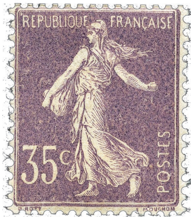
Semeuse maigre type 1.

Quel collectionneur ne possède pas dans ses albums des Semeuse ? Ces timbres sont passionnants à collectionner car, entre autre chose, ils réservent parfois de bonnes surprises. L'existence de types, sous-types et variétés, est l'apanage des Semeuse et bien entendu la cote s'en ressent. Ce mois-ci redécouvrons le 35 c. Entre la « maigre » et la « camée » les spécialistes affichent vite leur préférence. Normal, la cote varie de 18 € à 1 100 €. A vous de savoir identifier les « bons » timbres, cet article devrait y contribuer.