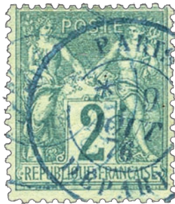
2 Les cachets à date à l'encre bleue sont rares.