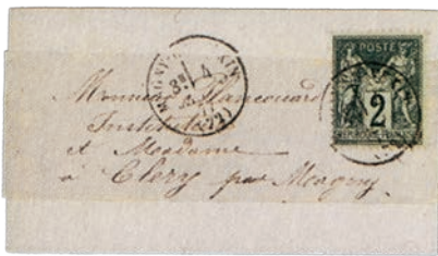
1 Souvent collés à cheval sur la bande et l'imprimé, les petits Sage ont fini en deux morceaux.