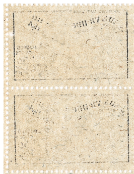
Un fragment de papier antimacule. Celui-ci a servi lors de l'impression du timbre Jean de Vienne.

Sur les 60 tonnes de ce papier demandées pour l'année 1942, 8 631 kg ont pu être obtenus, c'est-à-dire le septième seulement des besoins.