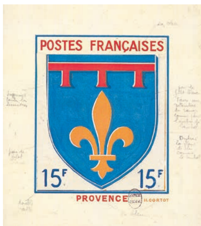
Maquette originale