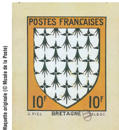
Maquette originale

Dossiers d'émission des archives du musée de La Poste (Paris).