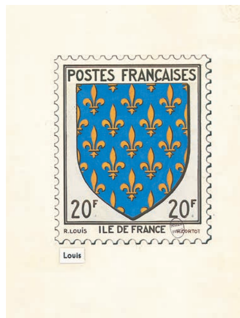
Maquette originale

quatre blasons émis en 1946 : ils montrent les quatre provinces qui étaient convoitées par l'ennemi et surtout ils surprennent par la qualité de leur réalisation ! A la différence des séries de 1943 et 1944, ils sont pourvus de petites valeurs faciales permettant l'affranchissement des journaux et de certaines catégories d'imprimés. Il en sera ainsi jusqu'à la fin des années 1950 où, étonnement, la Poste continue d'émettre des blasons libellés en centimes bien que les pièces de monnaie correspondantes n'existent plus ! On ne pourra donc se procurer des timbres comme par exemple les 70 c Lyon ou 80 c Toulouse de 1958 qu'en les achetant par dizaine.