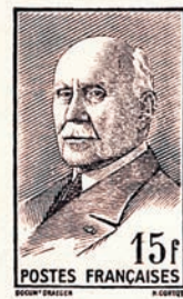
Les projets en typographie de Cortot non acceptés.