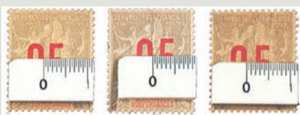
Timbre normal : l'espacement des chiffres est de 1,75 mm Timbre de la case 10 : l'espacement des chiffres est de 1,75 mm. Cette variété est bien évidemment fort rare. Timbres des cases 35, 55, 60, 100, 110, 120 et 130 : l'espacement des chiffres est de 2 mm.

On surcharge des timbres de l'émission de 1892-1907. Ces surcharges comportent des variétés dites « chiffres espacés » dont il était déjà question dans le Timbres magazine daté janvier 2004. Pour les reconnaître, prenez une règle :