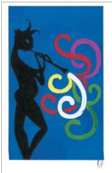
Maquettes acceptée et refusées du timbre Europa, fête de la musique (YT 3166)

dessiné, j'étais toujours premier en dessin. Je ne me rendais pas compte que le dessin était ma façon de respirer, ma bouée de sauvetage. A 14 ans, il m'a fallu choisir : je voulais être pilote d'avion mais j'étais tellement mauvais en mathématiques que j'ai compris que le dessin était incontournable. Après mon brevet, je suis rentré à l'école