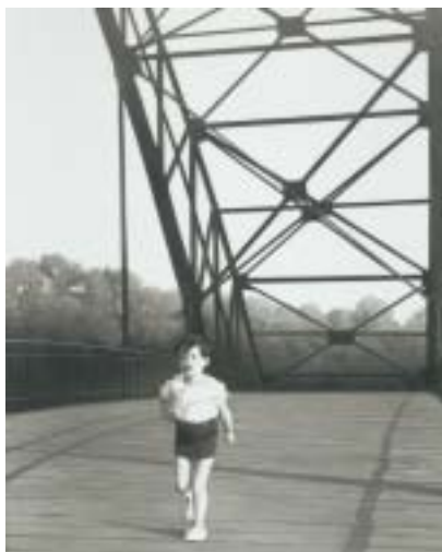
Œuvre personnelle, peinture à l'acrylique appartenant au recueil « Vitesse de la lumière instantanés »