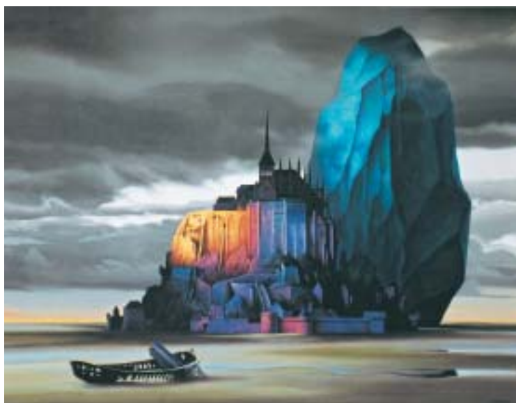
« Hadès », peinture